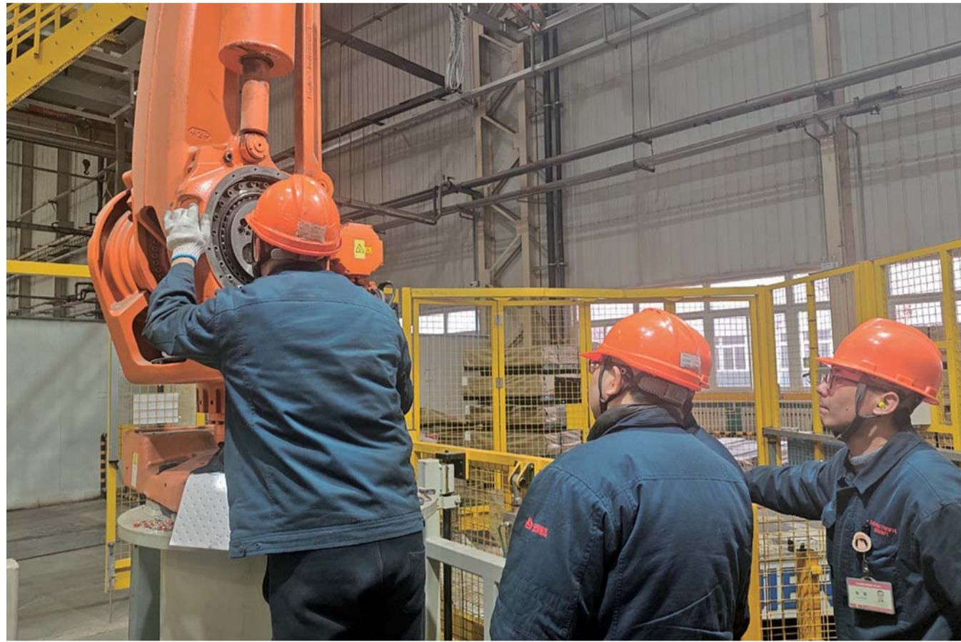
攻坚时刻,坚决啃下“硬骨头”

应急响应机制启动后,机修团队立刻行动起来,他们带着检测工具和工具箱迅速集结到位,进入“战斗模式”。ABB机器人为高度一体化设计,出现故障的二轴减速机深深嵌入机械臂内部,周围是密密麻麻的液压管路和传感器线路,拆卸空间特别有限,稍微碰错一根线,碰歪一个部件,都有可能引发二次故障。面对这种情况,机修团队第一时间确定了“三步走”维修方案:第一步,精准定位故障源,借助机器人近期运行日志,确定传动异常原因;第二步,确保备件及时到位,从备件库调取原厂同型号减速机;第三步,精心做好维修准备,利用激光定位仪做好标记,确认每一个安装点的位置。